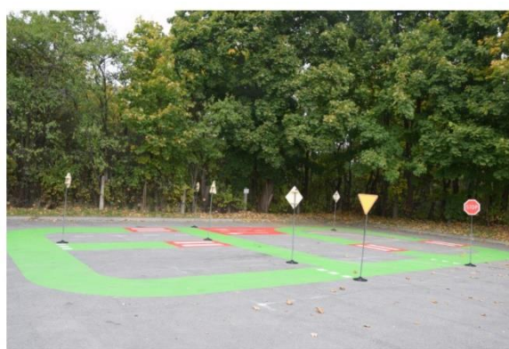
Malowane miasteczko rowerowe w Szydłowie.