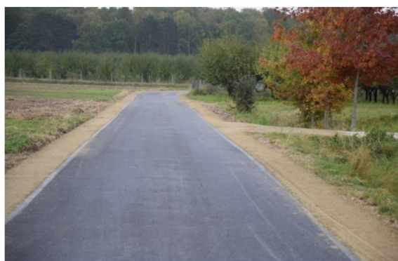
Przebudowa drogi nr ewid. dz. 121 w miejscowości Mokre, od km 0+000 do km 0+450.