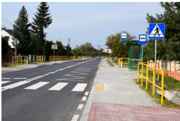
Wyremontowany odcinek drogi wojewódzkiej nr 756 - ul. Solecka w Szydłowie.

W ramach programu z usługi asystenta skorzystało 6 rodzin, wydatkowano kwotę 41.413,29 zł., środki w całości pozyskane z Funduszu Solidarnościowego.