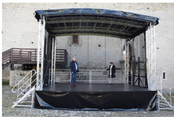
Mobilna scena 6x4 m. zakupiona dzięki dotacji z MKiDN.