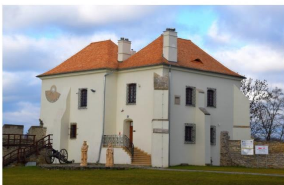
Szydłów, zespół Zamku Królewskiego, budynek „Skarbczyka” (XVI w.): prace remontowe dachu.