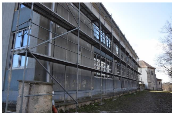
Termomodernizacja budynku użyteczności publicznej – Szkoły Podstawowej przy ul. Szkolnej 12.