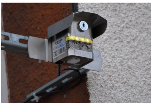
W Szydłowie, Korytnicy i Solcu zainstalowano czujniki do pomiaru stężenia pyłów zawieszonych.