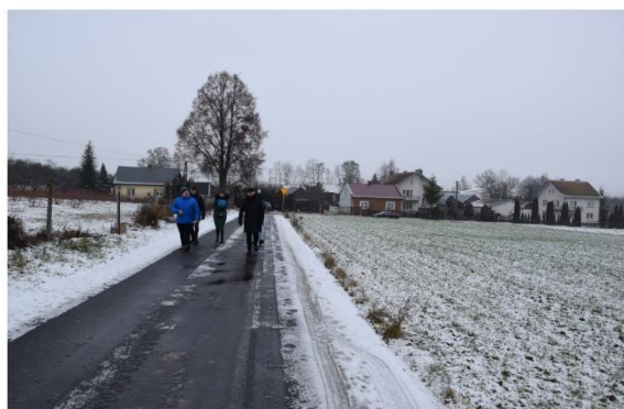
Przebudowa drogi wewnętrznej nr ewid. dz. 644 w miejscowości Katuszów, od km 0+000 do km 0+535.