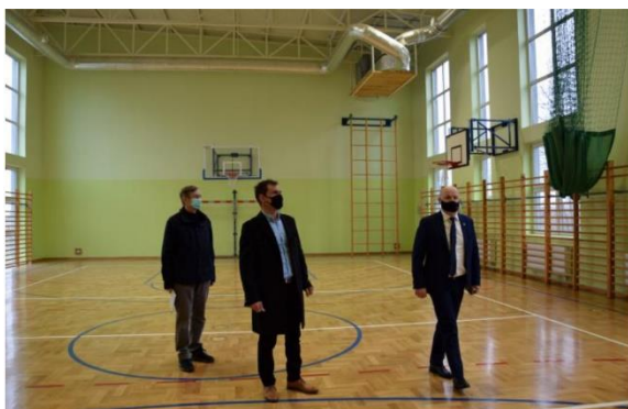
Przebudowa dachu budynku sali gimnastycznej z częścią dydaktyczną.