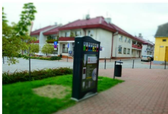
Miejski Punkt Elektroodpadów w Szydłowie.