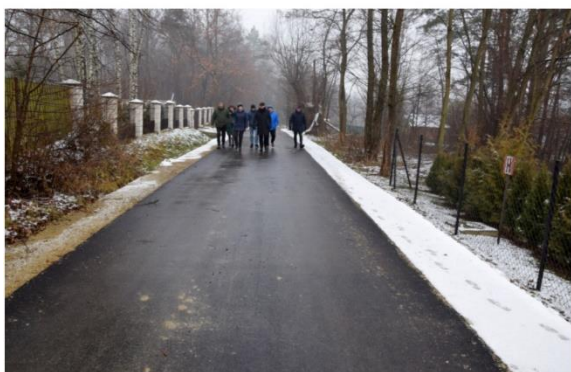
Przebudowa drogi nr 390027T Korytnica – most, od km 0+000 do km 0+370.