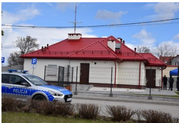
W dn. 8 kwietnia oficjalnie otwarto Posterunek Policji w Szydłowie.