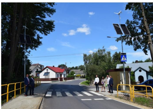
Tzw. bezpieczne przejście w Katuszowie.