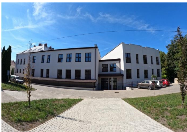
Termomodernizacja budynku użyteczności publicznej – Szkoły Podstawowej przy ul. Szkolnej 12.