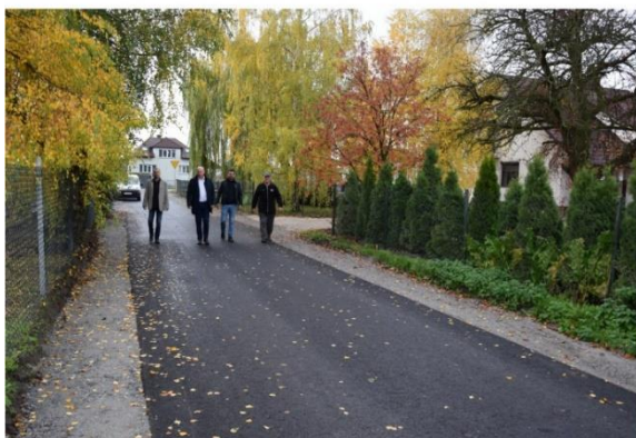
Przebudowa drogi gminnej 390045T w Szydłowie.