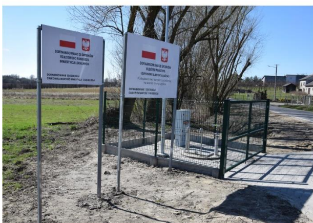
Rozbudowa sieci kanalizacji sanitarnej na terenie Gminy Szydłów w miejscowości Gacki.