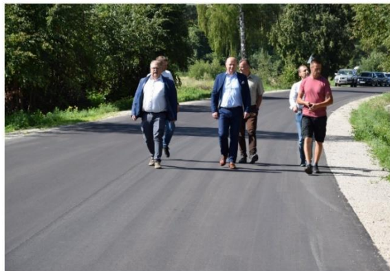
Wyremontowany odcinek drogi gminnej 390062T Jabłonica - starodroże.