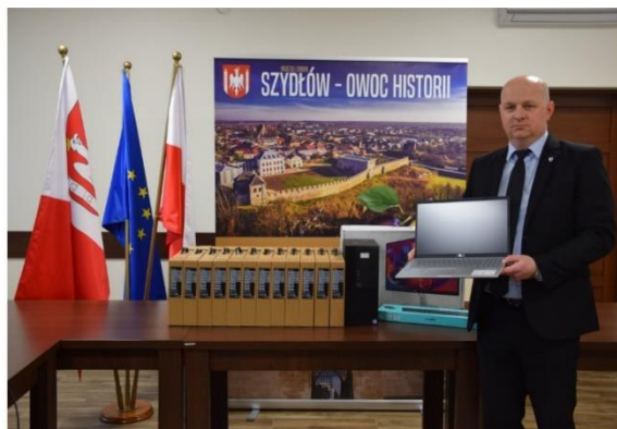
Przekazanie 14 zestawów komputerowych w ramach projektu „Wsparcie dzieci z rodzin pegeerowskich w rozwoju cyfrowym”.