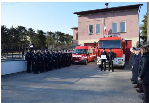
Ciężki samochód ratowniczo-gaśniczy MAN GCBA 4x2 dla OSP Kotuszów.