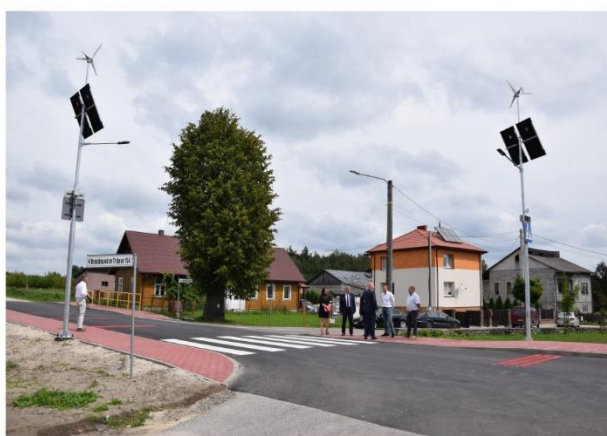
Tzw. bezpieczne przejście w Brzezinach.