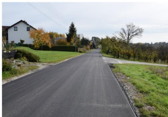
Droga powiatowa nr 0036T Gacki – Mokre została wyremontowana na odcinku 4 km 150 m.