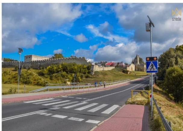
Tzw. bezpieczne przejście w Szydłowie, ul. Kielecka.